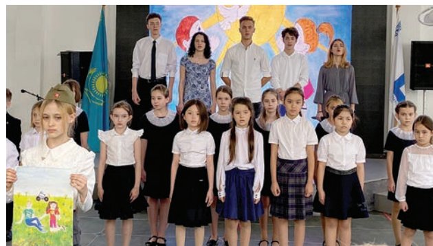
Чтобы всем был сегодня слышен голос юных граждан Земли! Песню «Отмените войну» исполнили ученики 3-х классов