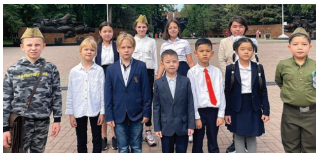
Учащиеся 1-4 классов у Вечного огня в парке имени 28 гвардейцев-панфиловцев

5 мая была подготовлена литературно-музыкальная историческая композиция, где, казалось, страницы Великой Победы ненадолго ожили, перенесли нас в то далёкое суровое время, время подвига всего советского народа. Кадры видеороликов, фотографии помогли всем по-новому взглянуть на события военных лет. Участники композиции вспоминали о великих героических битвах, говорили о женщинах, которые из последних сил делали все возможное для фронта, для Победы, о детях, которые рано и быстро выросли, в годы войны были разведчиками, партизанами, работали на заводах, выпускали снаряды, собирали тёплую одежду для бойцов, выступали с концертами перед ранеными. И минута молчания, заставившая всех вспомнить,