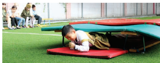
«Веселые старты». Полоса препятствий преодолена!