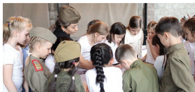
«Веселые старты». Необходимо расшифровать полученные сведения!