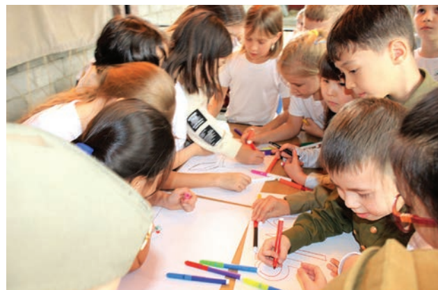
Дружно справимся с любым заданием!